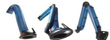
Original NEX-MD NEX-HD

Los mejores brazos en su clase, son fáciles de localizar y mantienen su posición de forma segura